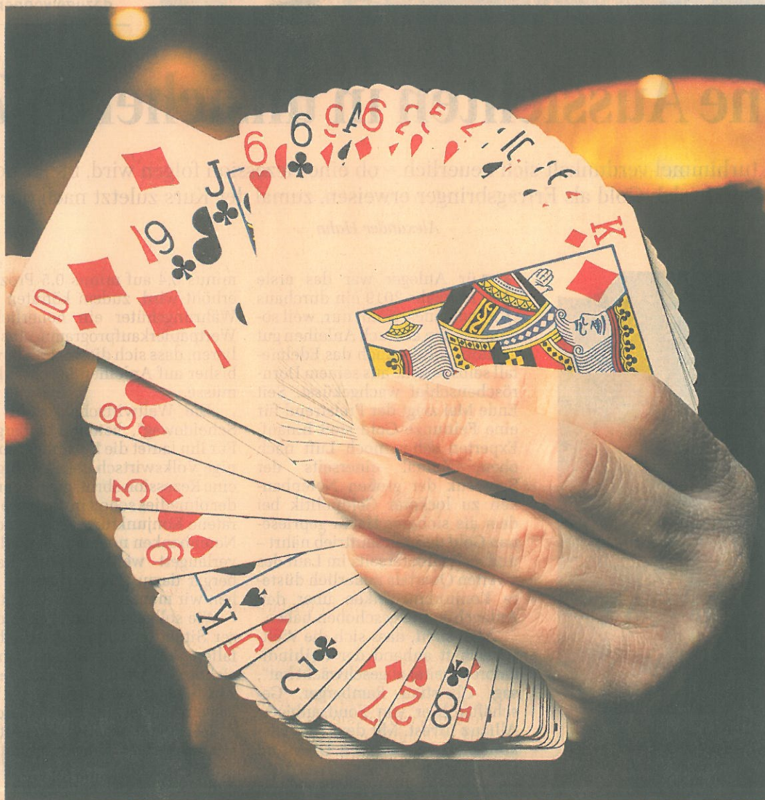
Ein Fondstausch ist für Anleger nicht immer ein sicheres Spiel. Das Ass bleibt oft verdeckt.

Der Versicherungsnehmer hat seine Prämien monatlich bezahlt. Fünf Jahre später bekam er die Mitteilung, dass die Versicherung den Fonds verschmelzt, der ursprünglich vom Kunden gewählte Fonds in einem anderen Produkt aufgehen werde und die Höchststandsgarantie in den infrage kommenden neuen Fondsvarianten nicht mehr vorhanden ist. Der Kunde konnte also nur noch aus Produkten wählen, die keine Garantie mehr beinhalteten.